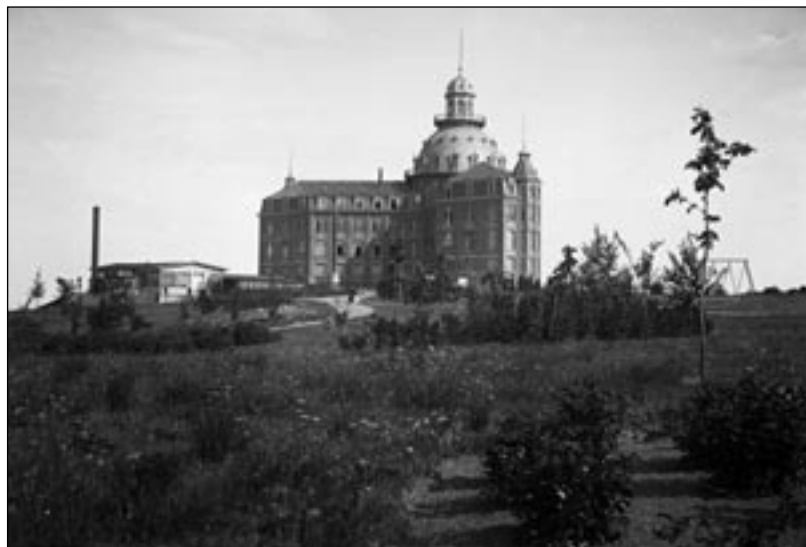
Emile Detry, Le Grand Hôtel de la Citadelle, avec sur la gauche, le local d'arri- vée du funi- culaire. Col- lection Phi- lippe-Edgar Detry

L'angle de prise de vue de cette photographie est inhabituel, le château étant généralement présenté en contre-plongée depuis le faubourg de La Plante ou en façade principale avec son imposante tour d'angle.