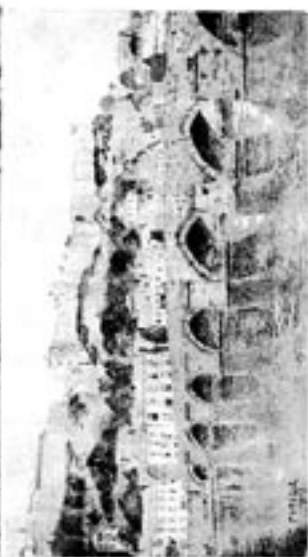
Ci-contre : Vue du pont de lambos et du château central . Signé et daté en bas à gauche : «Endrie, 1917». Aquarelle inédite, probablement due à un militaire allemand faisant partie des troupes d'occupation.

défilé, mais sans réellement les étudier pour eux-mêmes. Les autres sont uniques, inédits ou tellement peu connus qu'ils méritaient une présentation particulière, dans un album grand format comme.